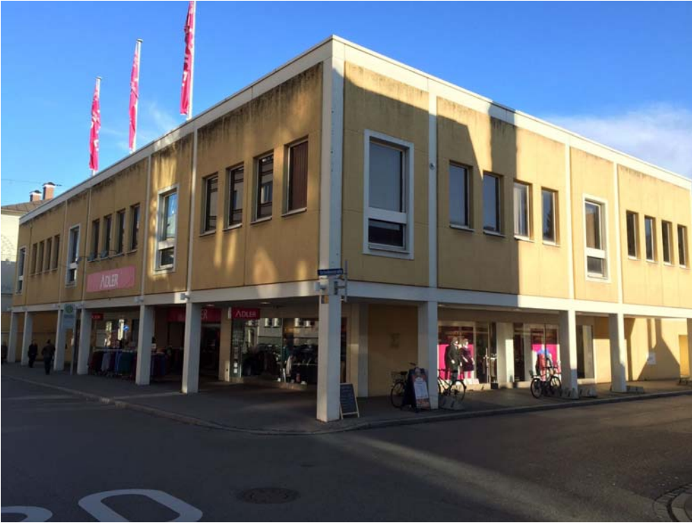
Bildunterschrift: Das gewerblich genutzte Gebäude in der Kottener Straße 80 vor dem Umbau.